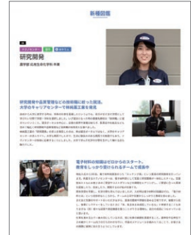
▲ 従業員紹介ページ「新種図鑑」