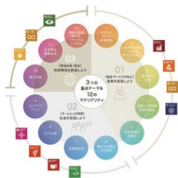
▲ サステナビリティ体系図