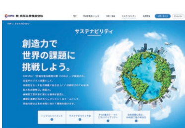
▲ サステナビリティページ

また、重点テーマと重要課題、具体的な取り組みをグルーピングして図式化することで、社内外に向けてよりスムーズな理解の促進を図った。